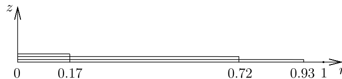
Рис. 2. Схлопывание каверны с учётом подъема внутренней свободной границы жидкости при h = 3 ; \tau = 0.1, 0.2, 0.29

На рис. 2 показана динамика круговой линии отрыва с учётом подъема внутренней свободной границы жидкости. Для наглядности расчёты выполнены при \varepsilon = 1 . Отметим, что на основе формулы (3.7) можно получить простую оценку для поперечного размера каверны в главном асимптотическом приближении: 0 < \zeta(r, \tau) \leq \varepsilon^2 \tau . Таким образом, возмущение внутренней свободной границы жидкости будет оставаться малой величиной в широком диапазоне изменения параметра \varepsilon (в рассмотренном примере это возмущение будет совсем небольшим даже при \varepsilon = 1 ). Также обратим внимание на то, что, зная c_0(\tau) , можно определить зависимость радиуса круговой линии отрыва от безразмерного времени t с помощью элементарного пересчёта ( t = \varepsilon \tau , 0 < \varepsilon < 1 ).